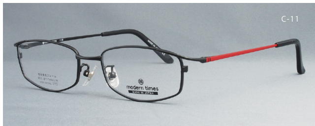
modern times - 1128 51□17-139 H29.0