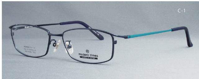
modern times - 1126 53□16-139 H30.5

テンプル表面に色鮮やかな印刷等を施しながらも、スリムな フォルムなので主張しすぎないさりげないオシャレ感を演出 トレンドもベーシックも外さない それが modern times