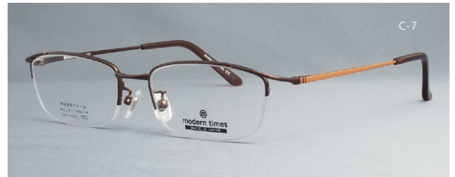
modern times - 1127 52□17-139 H30.0