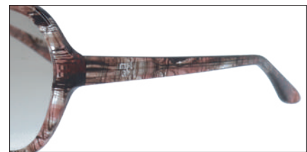
C-4 BRチェック レンズカラー:BRH 透過率:40%