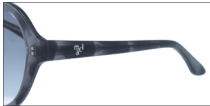
C-1 GYササ レンズカラー:SMH 透過率:40%