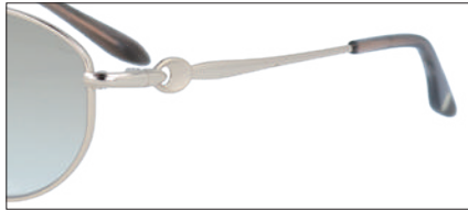
C-1 CPGP レンズカラー:BRH 透過率:60%