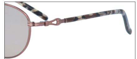
C-3 BR レンズカラー:OR 透過率:60%