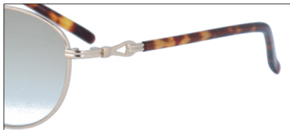
C-1 CPGP レンズカラー:BRH 透過率:60%