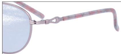
C-2 PK レンズカラー:PK 透過率:80%