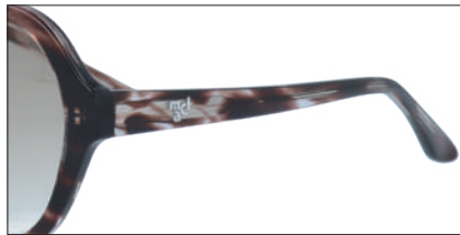
C-2 BRササ レンズカラー:BRH 透過率:40%