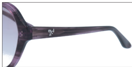
C-3 PUササ レンズカラー:PUH 透過率:60%