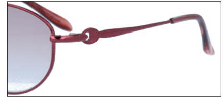
C-3 WN レンズカラー:PUH 透過率:60%